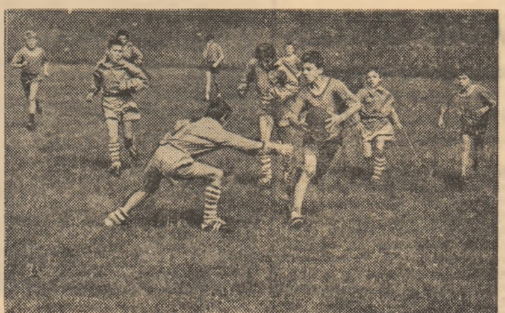
Vacanța de vară, prilej de odihnă activă pentru toți copiii patriei, oferă un binevenit prilej pasionaților sportului cu balon oval din rîndul celor mici de a lua parte la competiții rezervate lor. În imagine, o secvență dintr-un meci de rugby între piticii lui R.C. Grivița Roșie și cei ai Școlii nr. 8 din Birlad...

Ștești, dar și la învățătură vor fi prezenți, de asemenea, la Forumul Național al Organizației Pionierilor de la Năvodari, acolo unde — alături de o suită de bogate activități — exercițiul fizic va fi transpus în interesante întreceri la mai multe discipline. Să mai reținem, în fine, faptul că pionierii cu cel mai bogat palmares sportiv în anul școlar care s-a încheiat vor avea ocazia să petreacă o minunată va-