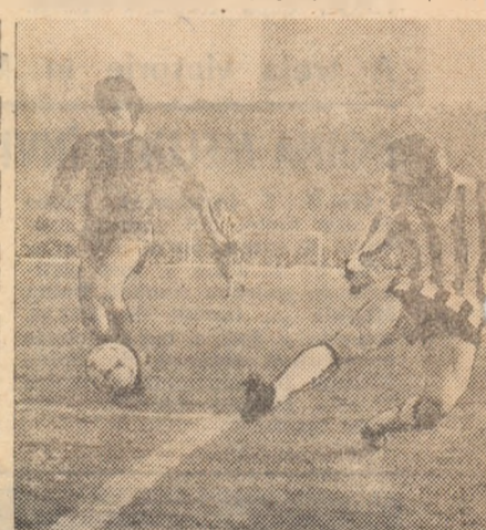
Bozeșan în acțiune. Poate că racordarea fi o bună soluție.

Se știe — s-a mai spus și s-a mai scris — că Sportul Studentesc a acuzat din plin modificarea de stil intervenită după retragerea lui M. Sandu — prematură, am spune noi, dacă n-am tine seama că actualul membru al conducerii alb-negri