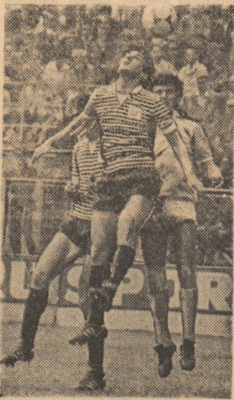
Ciocan (tricou în dungii) unul din cei mai buni apărători ai echipei clujene, remarcabil prin plasament și detenție.

Poate juca Universitatea Cluj-Napoca un rol mai important în ediția următoare? Noi credem că da! Are tot bun, campionatul trecut a contribuit la maturizarea multor jucători, la omogenizarea echipei, se bucură de o conducere activă și competentă, de un fidel cerc de foști jucători care sprijină clubul și echipa, de marea simpatie a tineretului din al doilea centru universitar al țării, de sprijinul larg al organelor locale.