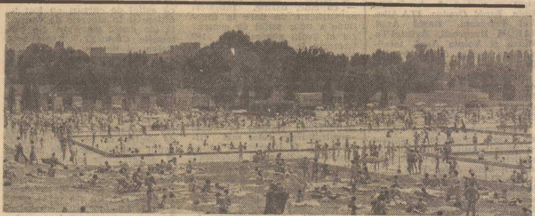
Animație firească la unul din bazinele de înot de la ștrandul Dimbovița