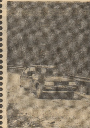
In probele de clasament, contracronometru, autoturismul și „natura”. Frumoasă, dar grea...

Când s-a dat startul (ora 13.01) din centrul municipiului Miercurea Ciuc nu bănuiam că vom asista la unul din cele mai interesante (dar și bine organizate) curse de acest gen din ultimii ani. Dispute dirze; desfășurarea, unele dramatică am spune. a