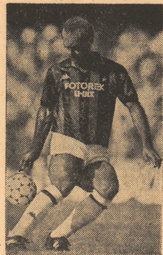
Paris Saint Germain își pune mari speranțe în Ray Wilkins