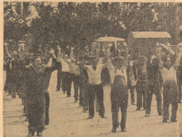
Gimnastică la locul de muncă, la unul din ateliere.