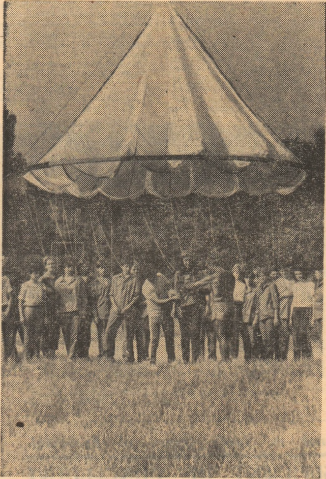
La Turn, în tabăra de parașutism, liceenii deprind arta de a coborî din văzduh

rile aviatice, în general. N-a spus direct, dar a spus frumos. — Frumos, dar nu corect. Turnul de parașutism nu e chiar atât de tînăr, curînd îi vom sărbători 35 de ani de existență. — Îi scazi un punct? — Îi scad două puncte: în aviație nu merge cu aproximație, trebuia să spună exact ce suprafață are parasuta. — E vacanță, maestre!