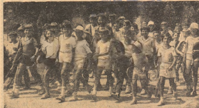
Mai mici și mai mari, cu voințe spre același țel: un loc pe „tabloul” Campionatelor Naționale ale copiilor...

50 cmc, juniori — M. Stan (CJAK IRA Teucei); 50 cmc, cadeți — M. Muntean (Danu-