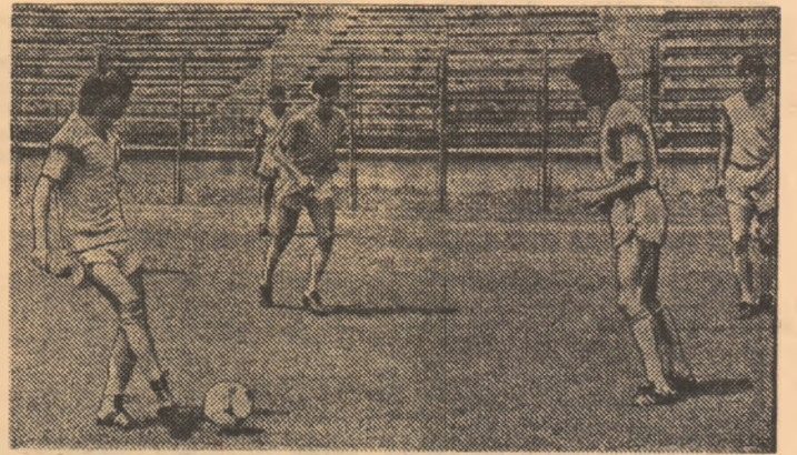
Pe stadionul care găzduiește de azi turneul, iată-i pe jucătorii de la Steaua la unul din antrenamente.

De azi, însă, în Capitală, fotbalul intră, cu adevărat, în scenă. Stadionul, frumosul stadion al echipei campioane, a îmbrăcat „haine de gală”. Aici, astăzi și mâine, Clubul Sportiv al Armatei Steaua organizează în cinstea zilei de 23 August și cu prilejul a 40 de ani de activitate a clubului, unul dintre cele mai interesante turnee internaționale de fotbal. O participare selectă, cu reprezentante ale fotbalului din