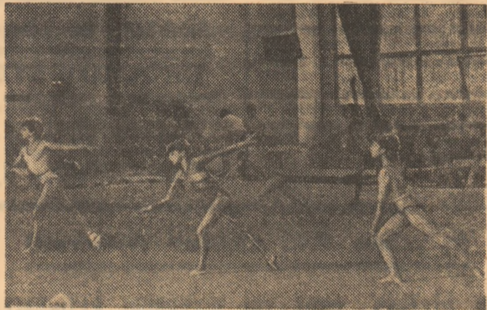
Exerciții de pregătire fizică cu gimnastele pentru „Cupa Prietenia”