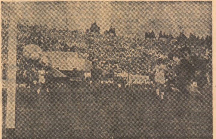
Min. 75: mingea expedită de Hagi l-a depășit pe portar, dar a lovit bara și a ieșit din teren

Cu drumeții sibieni pe crestele Făgărașului