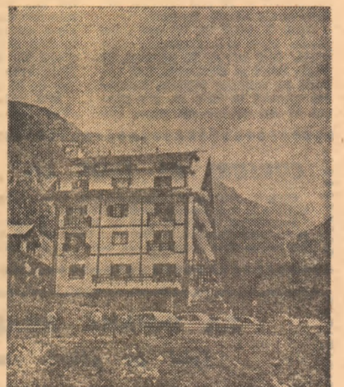
Aici, la cabana-hotel Bilea Cascadă a fost locul de adunare al turiștilor sibieni...

De cum ajungeau la cabană, consultau o schișă afișată, din care aflau locul unde se stabilise să-și facă tabăra de corturi. Estetica bivouacului — conform regulamentului — era punctată în clasament. Pe înserat totul a fost gata. Prelutindeni, parcă semănate de o mină harnică, multe corturi multicolore ale cercurilor de turism din județ (Sibiu, Clisădie, Mediaș, Mirșea ș.a.), fiecare cu emblemă și steag propriu.