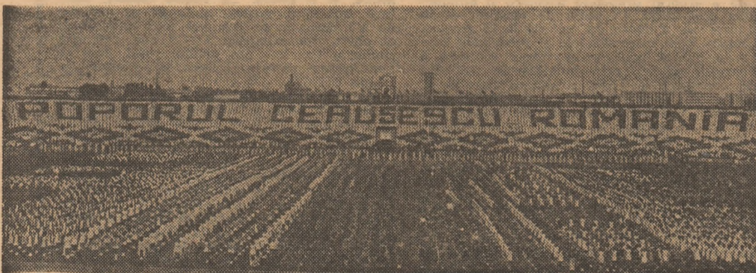
Amplele manifestări din cadrul „DACIADEI” constituie o puternică expresie a sănătății și vigorii tineretului nostru, a înaltei sale conștiințe revoluționare