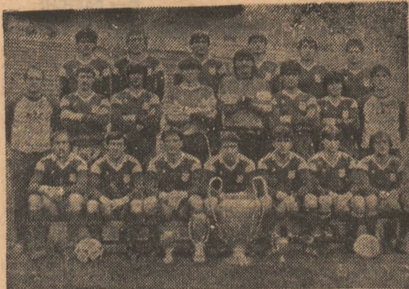
Echipa de fotbal Steaua București câștigătoare a „Supercupei Europei”