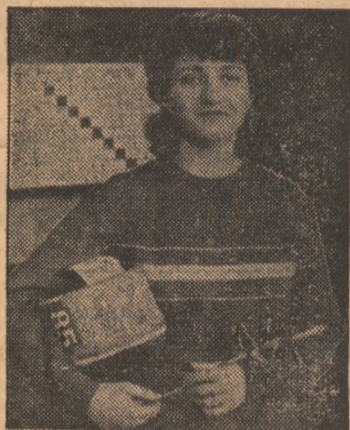
Câmpioana lumii Elisabeta Tufan

Între altele, agenția austriacă de știri A.P.A. subliniază: „Floretista română Tufan, căreia, inițial, nu i se acordaseră prea multe șanse, alte scrimeri fiind considerate ca favorite ale întrecerii, a avut o evoluție remarcabilă. Promptă în decizii, foarte sigură pe sine, minșind cu măiestrie floreta ea nu a lăsat nicio speranță adversarelor sale, câștigând categoric și absolut meritat...”