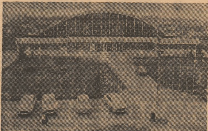
În noul peisaj al orașului Alexandria, o modernă sală a sporturilor

Evident, se împlinște harța construcțiilor sportive. La ora de față peste 15 000 de baze și terenuri dotate cu aparatura și instalațiile necesare stau la dispoziția milioanele de oameni, de diverse vârste și profesii, care-și petrec orele de răgaz în mod plăcut și util participînd la popularele concursuri ale „Daciaadei”, adevărate izvoare de sănătate și vigoare fizică și intelectuală.