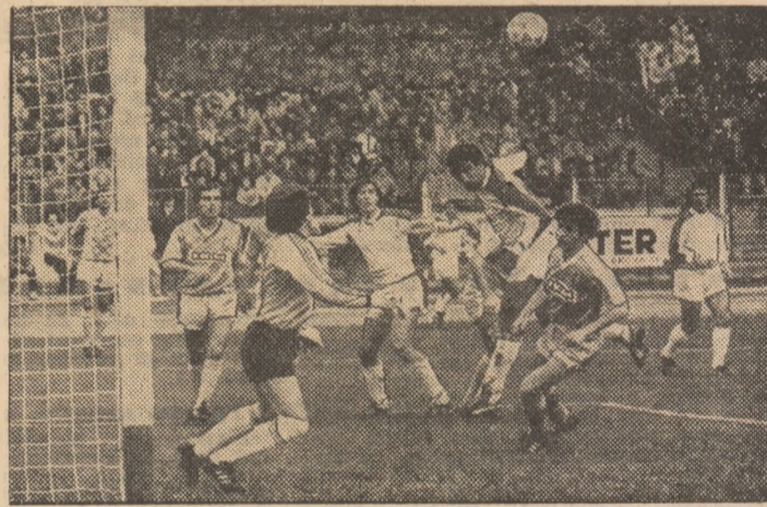
Un nou atac bucureștean, cu Augustin în prim-plan, rămas fără rezultatul dorit pe tabela de marcaj (Față din meciul Victoria — Dinamo Tbilisi)