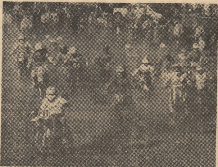
Secvență de pe traseul de la marginea municipiului Sibiu