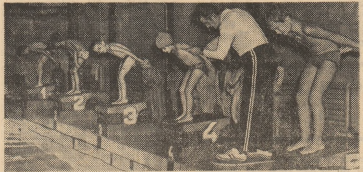
Viitorii „delfini” de la Școala nr. 281, la ora primelor lansări de pe bloc-starturi, sub îndrumarea atență a prof. Constantin Turcaș...