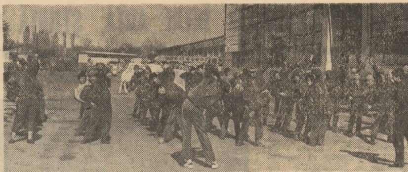
Cînd vremea permite, se iese din hală și exercițiile se fac în aer liber