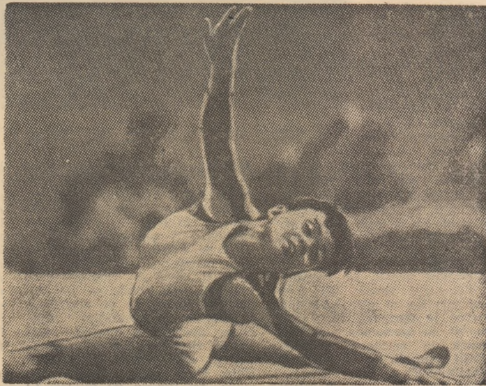
Aurelia Dobre „a impresionat prin valoare, constanță și perfecțiune” („Deutsche Sportecho”)

Toate aceste calități au fost, pe rînd sau simultan, subliniate, suma lor fiind chiar cheia unei izbînzii de avengură. Ziarul olandez „Volkskrant”, de pildă, nota pe marginea evoluției campioanei absolute a lumii că „prin Aurelia Dobre se poate vedea că gimnastica de