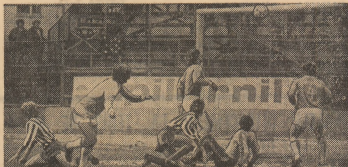
Goanță - căzut - a trimis, cu capul, sub transversală, unde mingea va ricosa în plasă. Fază din meciul Rapid - „Poli”