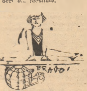
La Ploiești, s-a deschis „Muzeul Sportului”

Ceasta noastră de gimnastică dovedit iarăși superioritatea la Campionatele Mondiale