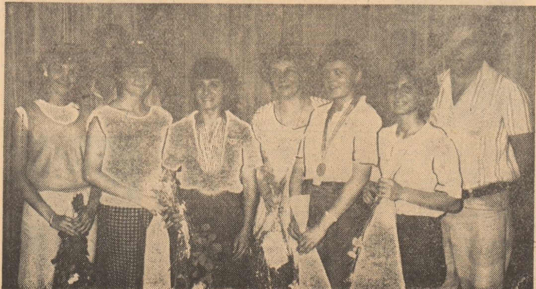
Floretistele noastre s-au întors de la „mondiale” cu un „aur” și un „argint”

Chiar la a Campio inot, de l august, în coperită S mai înalt țat drapel niei, ma ascendent tre, o noi mul titlu lul senior ceeași N bîimărean antrenoru meca, nu pioană n vedetele loare ale a deținut obținute ca la după Zag sezonul c proba pr Doar după fluture, pe poziți lel, pentu cîndu-și de spatis conducere pînă în de au 4:40,21, t dială, net vleticii D campion (R.D.G.) următor