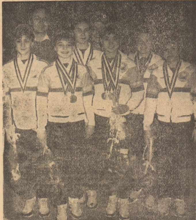
Școala românească de gimnastică și premiantele ei

Seară de sfîrșit de februarie. Stadionul din Monte Carlo, luminat a giorno ca pentru un spectacol de gală, este gata să primească în teren cele mai bune echipe de fotbal ale bătrînului continent, Steaua București, campioana europeană a cluburilor, și Dinamo Kiev, cîștigătoarea Cupei Cupelor în 1986, venite să-și dispute cea de a 12-a ediție a Supercupei Europei. Peste 120 de ziaristi așteaptă cu emoție profesională primul fluier al arbitrilor italian Luigi Agnolin, iar în final consemnează, nu numai vic-