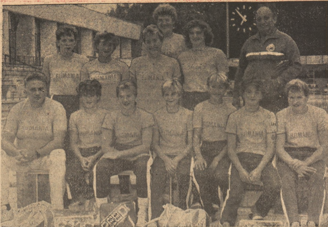
Prezent și... viitor, în inotul românesc

Cu un remarcabil bilanț s-au întors acasă cele 7 fete care au concurat la Strasbourg: 8 medalii — 2 de aur, 1 argint și 5 de