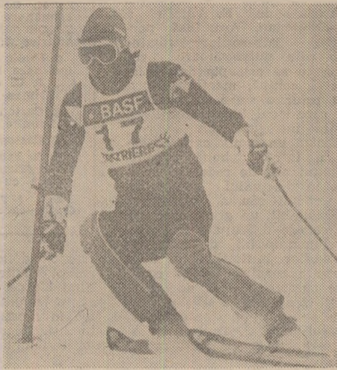
Va rezista, oare, în acest sezon olimpic, elvețianul Pirmin Zurbriggen, în imagine (cadruplu câștigător al Cupei Mondiale, pe probe, în sezonul trecut), puternicului atac al noii generații de schiori alpini conduși de impetuosul Alberto Tomba din Italia?

PARIS, 11 (Agerpres). „Cupa Mondială” la SCHI ALPIN a programat pe pista de la Val d'Isere (Franța) o probă masculină de slalom su-