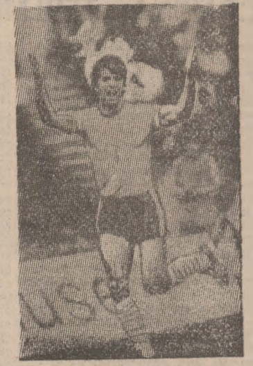
Internaționalul Nasko Sirakov (Vitoșa Sofia) - „Gheata de bro” 2” 1987