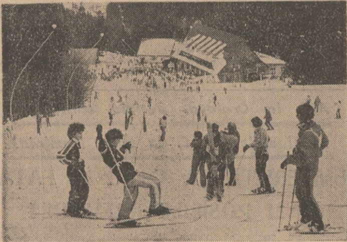
Schiul se înscrie printre ramurile de sport mult îndrăgite de către studenții din toate centrele universitare. Iată o parte dintre finaliștii „Cupei U.A.S.C.R. — 1987” pe pîrtia de la Clăbucet, în așteptarea primelor starturi...

sau în țară, la nivelul centrelor universitare din Cluj-Napoca și Timișoara Iași și Craiova, Tg. Mureș sau Galați etc., atrag mase impresionante de spectatori