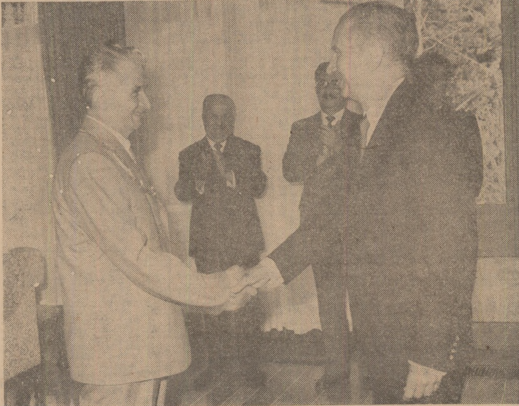
Aspect de la solemnitatea în cadrul căreia președintele NICOLAE CEAUȘESCU i-a fost înmînat, de către președintele Comitetului Internațional Olimpic, Juan Antonio Samaranch, „Ordinul Olimpic de Aur”, cea mai înaltă distincție olimpică

rea olimpică are un rol important în promovarea sportului internațional, a spiritului olimpic de prietenie și colaborare între sportivi și, în primul rând, între tineretul din diferite țări, care constituie de fapt aproape unanimitatea sportivilor de la toate Jocurile Olimpice. De la înființare și pînă acum, Jocurile Olimpice au avut, în diferite perioade un rol important în apropierea și cunoașterea sportivilor, a tinerilor, a popoarelor”.