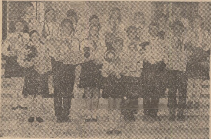
Reprezentanții echipajelor premiate, prezentînd trofee cucerite în 1987.

oameni de știință și cultură. Holul cel mare al Palatului, gazdă a festivității, era pregătit pe măsură. De jur împrejur, panouri — pentru fiecare trofeu în parte — cu numele unității învingătoare și fotografiile din „viața” expediției. În vitrine speciale, fuseseră trofee, iar pe cealaltă latură a încăperii purtătorii cravatelor, roșii oa și obrajiți celor veniți pentru a fi premiați.