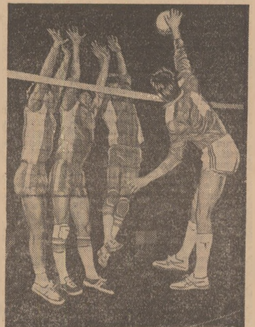
Prilej de satisfacție pentru iubitorii băcăuani ai voleiului: Viitorul Dinamo a în-trecut în Divizia A pe „U” C.F.R. Craiova.

tori să asiste la întrecerile pe teren acoperit) și te întorceai înaintea alergării de 3 000 m, unde se scosta, pe bună înțeles, un succes localnic, al elevilor lui Dorin Melinte, riscați să nu vezi decît dintr-o poziție dezavantajoasă sprintul