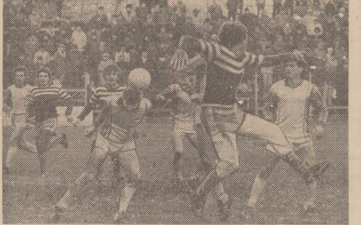
Iată una dintre fazele spectaculoase din partida Autobuzul — F.C. Olt. Ratează oaspeții...

F.C. MARAMUREȘ BAIA MARE — A.S.A. TG. MUREȘ 4-2 (2-1). Meciul s-a disputat pe un teren impropriu. A nins tot timpul. Golurile au fost marcate de Br-