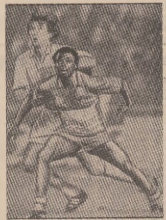
Abedi Pele (în prim-plan) și Ghana au ratat calificarea la J.O.