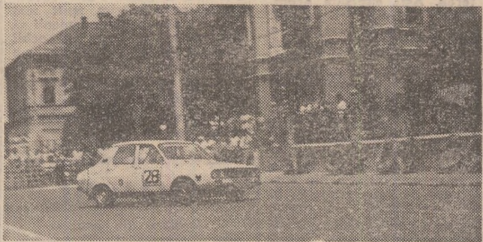
În cursă de viteză pe circuit N. Baban de la Volanul (echipa C.M.A.K. București)