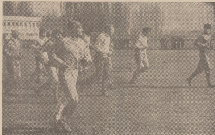
Aspect de la antrenamentul de ieri dimineață al steliștilor

Walter Smith - el au continuat chiar de a doua zi antrenamentele, conduse - în lipsa lui Anghel Iordănescu, pe cînt în Scoția pentru a urmări partida de campionat susținută de Glasgow Rangers, în deplasare, cu Dundee United - de antrenorul secund, Radu Troi. Acum,