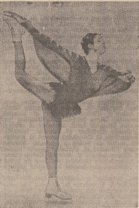
Katarina Witt (R.D.G.) pentru a doua oară campioană olimpică la patinaj artistic

La PATINAJ VITEZĂ, proba feminină de 5000 m a revenit sportivei olandeze Yvonne van Gennip, cu timpul de 7:14,13 — rezultat ce constituie un nou record mondial. Pe locurile următoare s-au situat concurențele