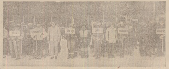
Momentul de deschidere a finalelor „Cupei U.G.S.R.“ la schi, cu sportivi din mai toate județele țării