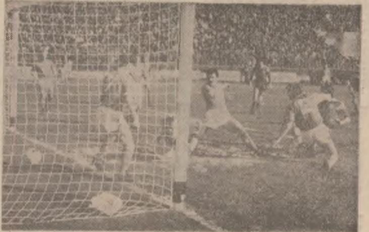
Așa s-a deschis ieri scorul în partida Steaua — Glasgow Rangers

spre entuziasmul tribunelor arhiple. A fost o primă repriză foarte bună a campioanei noastre, cu un început de-a dreptul fulminant, care a și dus la o rapidă deschidere de scor. Se intrase abia în minutul 3 cînd, la capătul unei presiuni puternice în careul oaspeților, aceștia s-au văzut nevoiți să cedeze. După ce tot