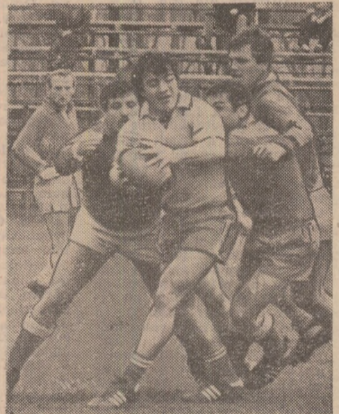
Și la a treisprezecea primăvară în reprezentativă, tot în „inima” disputei...

- Numai că pentru noi marea deschidere de anul trecut