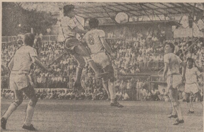
Mirea reia balonul cu capul spre poarta lui Crișan. (Secvență din partida Victoria - Universitatea Craiova, disputată în turul campionatului). Miine, cele două echipe se întînesc în Bănie în derbyul etapei