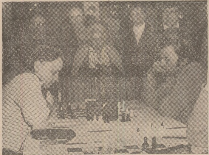
Aspect din meciul I.T.B. — Oțelul Galați, partida dintre marele maestru internațional Fl. Gheorghiu și maestrul FIDE N. Govdan

Clasamentul complet al finalei pe echipe mixte a fost următorul (sistemul de punctaj a constat din 3 puncte pentru meci cîștigat, un punct pentru meci nul și zero puncte pentru înfrîngere): 1. Politehnica București, 28 p. 2. I.T.B. 26 p. 3. EMT 26 p. 4. AEM 24 p. 5. Calculatorul 20 p. 6. Politehnica Iași 18 p. 7. Mecanică. Fină București 18 p. 8. Universitatea București 12 p. 9. Metalul București 11 p. 10. Volința Km. Vilcea 4 p. 11. Oțelul Galați 3 p și 12. C.S.M. Cluj-Napoca 3 p. Ultimele 3 echipe au retrogradat din prima divizie a