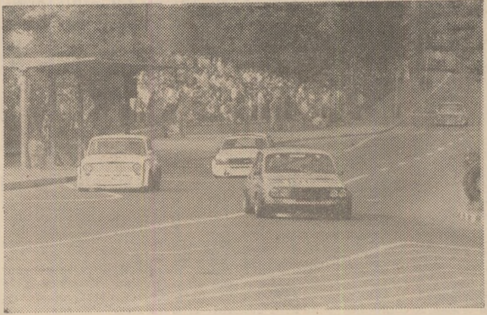
Un concurs-auto la Reșița este sinonim cu un eveniment sportiv de larg interes