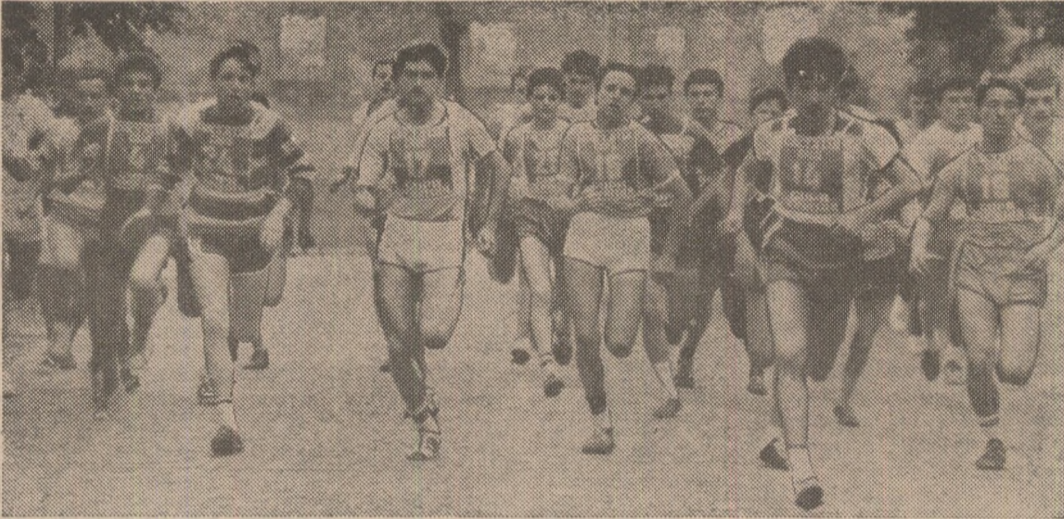
În plină alergare, finaliștii Crosului pionierilor, la categoria 13—14 ani