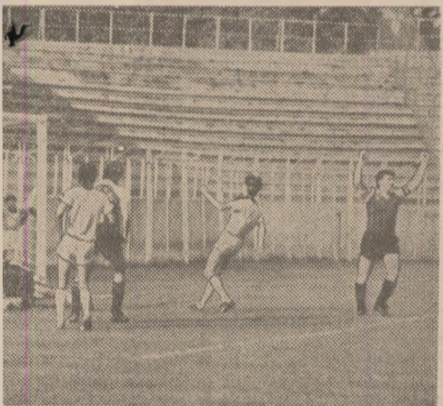
Intr-un meci din „zona fierbinte” a clasamentului.