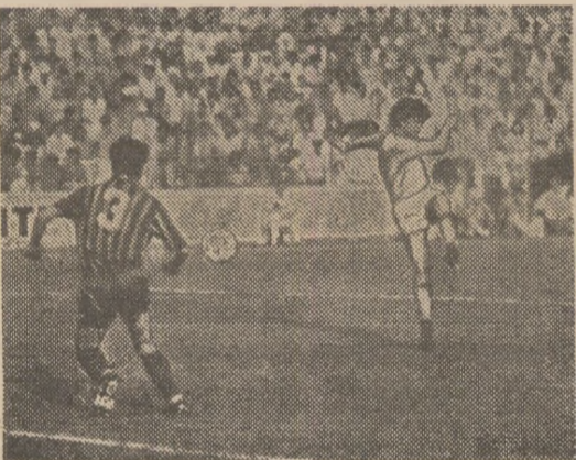
Fructificând centrarea lui Rotariu, Lăcătuș testează fără speranțe pentru portarul Moraru