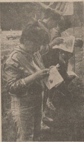
O dată startul fiind dat, concurenții studiază, fiecare, atenți, dar cit se poate de repede, viitorul traseu pe care-l are de parcurs... pas cu pas