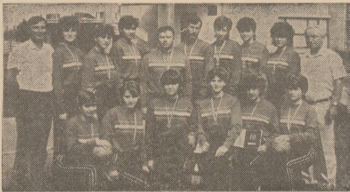
Echipa feminină C.S.S. 1 Galați - campioană națională a juniorilor și școlarilor, ediția 1988