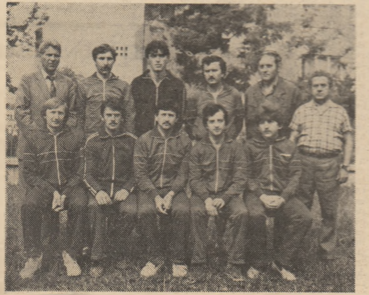
Aurul Baia Mare, la al 9-lea titlu