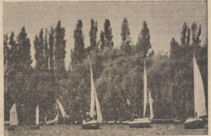
„Flotila-școală” de yachting iese în larg...