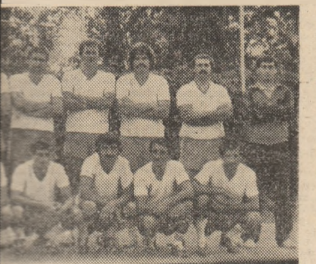
P. București a cîștigat, nu fără emoții a „Cupei U.G.S.R.” la oină.

fiu în dezacord cu deciziile „centralului” V. Derșidan (Oradea), ca jucătorii să lase friu liber nervilor și să vocifereze nepermis. Deși spiritele s-au liniștit destul de repede, „scăpările” arbitrilor de la linie au lăsat un gust amar celor prezenți. Rezultatele înregistrate în semifinale: Lami-