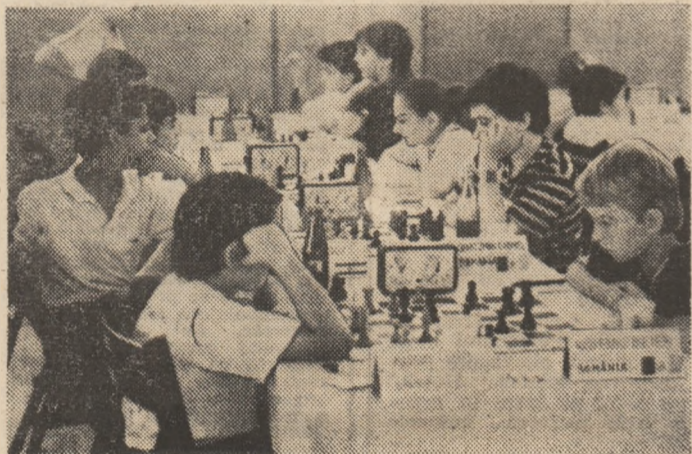
Aspect din sala de concurs, în timpul desfășurării rundei inaugurale.