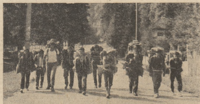
Drumejle montane nu numai în protecție, ci și în fapte!... Iată un frumos exemplu pe care ni-l oferă acest grup de elevi, membri ai cercului de turism al Casei pionierilor și școlilor patriei din municipiul Giurgiu. După un scurt popas la Cîmpulung Muscel, elevii giurgiuveni urcă, în pas voios, prin localitatea Voina, spre Iezer, unul dintre obiectivele de vacanță pe care și le-au propus în această „recreație mare“ a anului școlar...