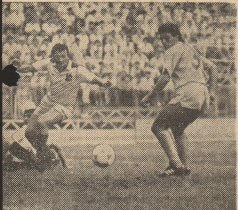
Lais, ambii căzuți pe linia porții, nu mai dar nici Coraș... (Fază din meciul Victoria