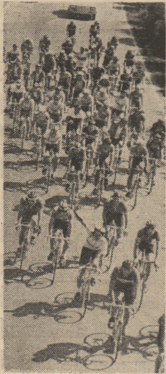
Acum călă, plutonul se va dezlănțui în „punctele fierbinți” ale etapei

● Korkmaz Salih (Turcia), învingător la sprintul final