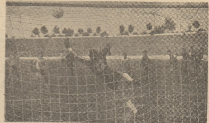
Iată excelentul gol înscris de I. Dumitrescu, din lovitură liberă, în meciul formațiilor de tineret România — Albania

toată seriozitatea de federației de fotbal pentru acest esalon al jucătorilor pînă la 21 de ani.