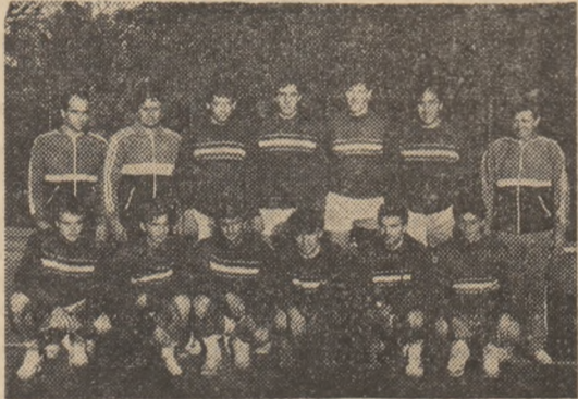
Steaua la al 28-lea titlu