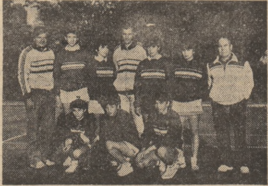
Dinamo, pentru a 17-a oară campioană

Ultima competiție oficială de tenis a acestui sezon în aer liber. Campionatul Național rezervat echipei masculine și feminine (prima grupă valorică) a continuat ieri, la arena Progresul și la Tenis Club București. Formațiile care au cucerit titlurile, Steaua - la masculin, și Dinamo București - la feminin și-au încheiat ultimele conturi și, cu aceasta, și un frumos bilanț al acestui an.