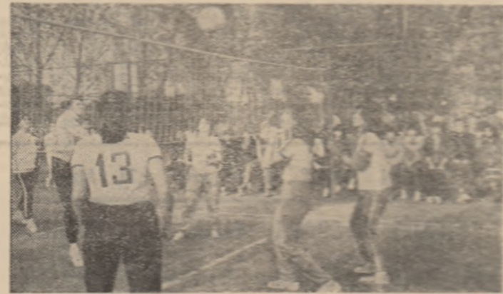
O secvență din întrecerea formațiilor de volei din cadrul „Cupai anilor I” la I.M.F. București.

Cu mai bine de trei decenii în urmă, colectivul catedrei de educație fizică și sport al I.M.F. București inițiază o acțiune sportivă de masă care avea să capete tradiție în rândul tineretului universitar din Capitală și din țară. Adresându-se celor care păseau pentru prima oară pe porțile instituției, întrecerea s-a și născut firesc. „Cupa anilor I” și ea a cuprins reacțiile de sport spre care „medicinii” bucureșteni manifestau cea mai mare atracție: atletism și gimnastică, tenis și fotbal, baschet și volei, handbal și sah.