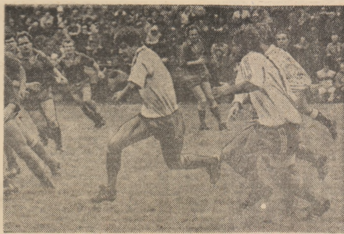
Atacul impetuos al lui Doja (cu balonul) vorbește de la sine despre dorința de victorie a dinamoviștilor