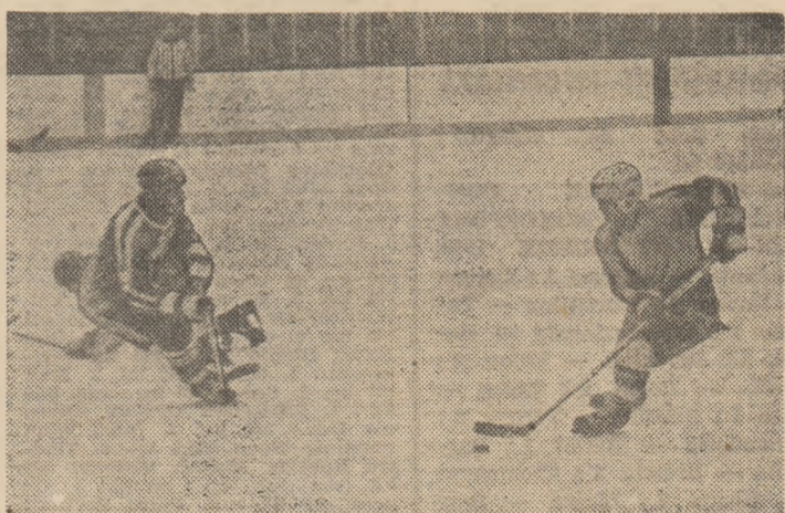
Steaua în ofensivă, cu Burada la puc, spre poarta echipei S.C. Miercurea Ciuc