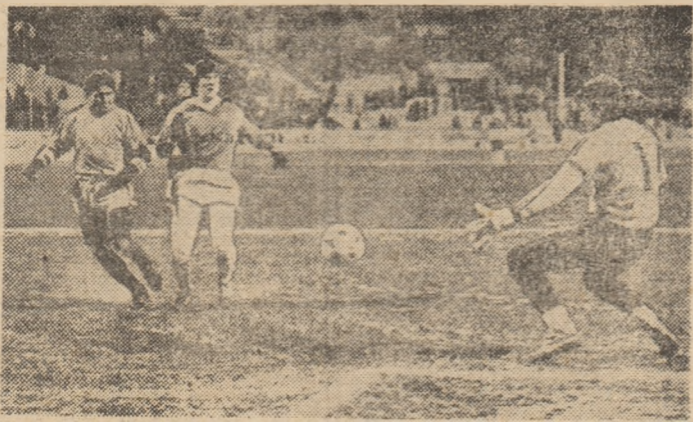
Dasaev față-n față cu Haği, sau portarul numărul unu al lumii la un pas de... pericol

N-a trebuit să treacă prea mult pentru a te convinge de faptul că, în pofida unor condiții favorabile mai degrabă echipei din Moscova, unde lărna aspră sosește mult mai devreme decât la București, superioritatea, pe toate planurile,