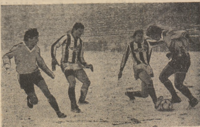
Victoria a trimis atac după atac spre poarta Turunului, dar vîrfurile ei (la balon, Damaschin I) n-au găsit drumul spre gol. Poate în partida retur...