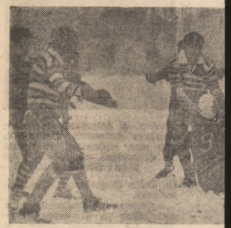
Fază din partida C.S.Ș. Locomotiva București - Mașini Grele Cluj-Napoca disputată pe un teren acoperit.