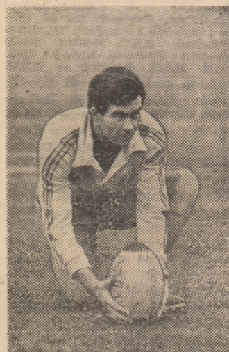
Va reuși, și de data aceasta, transformarea?...