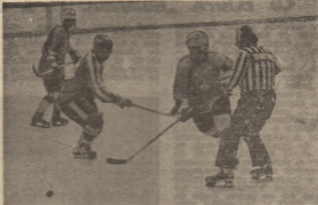
Între sporturile de sezon, hocheiul pe gheaţă cunoaşte un program deosebit de bogat, atât în ce priveşte echipele de club, cât şi reprezentativele naţionale de seniori, tineret şi juniori. Astfel că unele meciuri rămân abia s-au putut „înfiinţa“ în agenda federaţiei şi a cluburilor, în aceste zile, pe patinoarul „11 August“ din Capitală. Steaua, campioana, şi Dinamo vor susţine două partide duble, una chiar între ele, la 27 şi 28 decembrie, aşteptată cu nerăbdare de iubitorii hocheiului din Capitală.

Pe trambulina recent dată în folosinţă la Predeal s-a disputat, în deschiderea sezonului, un concurs de sărituri. Iată rezultatele — seniori: 1. A. Mezei (Dinamo Braşov) 208,6 p. (87,5+69 m), 2. O. Munteanu (Dinamo Braşov) 201 p. (63-63 5), 3. L. Balint (Dinamo Braşov) 187,9 (60,5+65,5); juniori: 1. M. Pestre (A.S.A. Braşov) 124,1 p. (35+44), 2. F. Brebeanu (C.S. Braşovia) 114,8 p. (41+56), 3. C. Ceasoc (C.S. Braşovia) 53,8 p. (41+41). Ion CODLEANU — coresp.