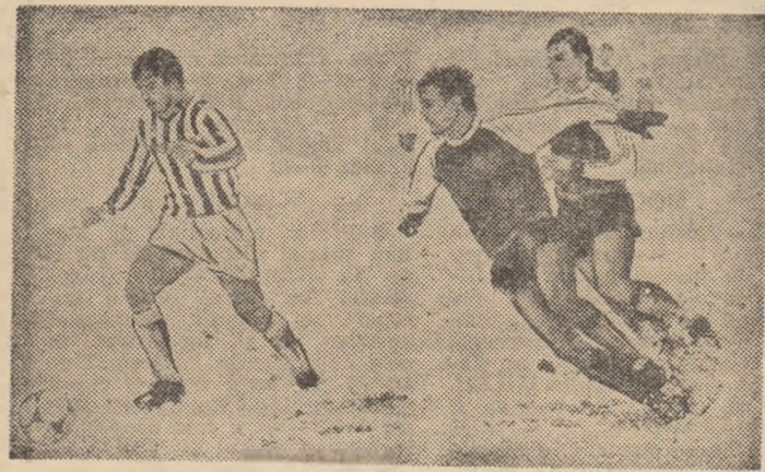
Se mai întîmplă și așa: meciul (în cazul de față Rapid — F.C. Bihor, ultimii în tricouri închise la culoare) aduce mai degrabă cu... un test al pregătirii fizice. Trecut cu bine de bihoreni, care s-au întors acasă cu un punct prețios.

pionat („întrecută” doar de F. C. Constanța cu 14 și A.S.A. Tg. Mureș cu 11). Ce s-a petrecut între timp, unde sînt golgeterii echipei care a promovat atît de spectaculos? Sigur, a plecat Culcear, un jucător mereu însetat de gol. Dar au rămas Ie, Ov. Lăzăr, Georgescu, Mandoca, Mureșan, cu toții aflați printre „puncherii” trecutului sezon. Ov. Lăzăr a punctat de patru ori, dar trei goluri au fost opera unei singure partide, în rest... Mujnai a înscris 5 goluri, dar, vedem caseta, două sînt din penalty, el rămînd, practic, realizatorul acestei fonații cu numai trei goluri înscrise din acțiune! Dar Mujnai este prin excelență un om de mij-