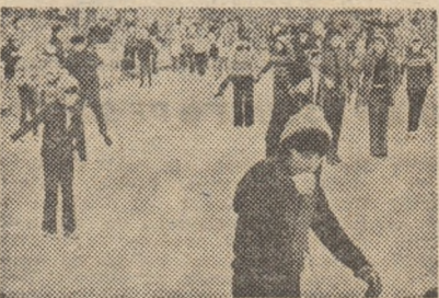
Așa cum ne transmite corespondentul nostru Ilie Ionescu, patinoarul din Sibiu și-a deschis de curînd portile marelui... public mic, în special copiilor. Iată o imagine grăitoare surprinsă de V. Cîrdei la acest patinoar, într-una din primele zile de funcționare

Prin amabilitatea Serviciului prevederilor de scurtă durată ale vremii din cadrul Institutului Meteorologic și Hidrologic, iată prognoza stratului de zăpadă din unele zone montane ale țării: Sinala, Cota 1500 32 cm, Babele 39 cm, Predeal 32 cm, Vîrfu lui Omu 43 cm, Fundata 32 cm, Poiana Brașov 23 cm, Bilea Lac 110 cm, Cozia 53 cm, Paring 60 cm, Păltiniș 24 cm, Semic 63 cm, Tarcu 25 cm, Moheasa 19 cm, Stîna de Vale 81 cm, Vlădeasa 90 cm, Tezeș 32 cm, Rarău 51 cm, Ceabînu Toacă 38 cm, Buchu 106 cm, Lăcăuți 14 cm.