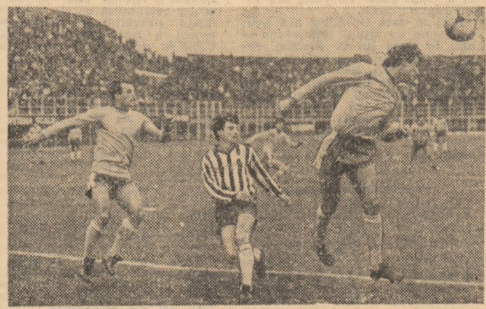
Apărarea echipei F.C. Farul a fost de multe ori la post, ca în această partidă de pe Giulești, cu Rapid, pe care constantăenii au cîștigat-o (2-1). De-ar fi fost la fel și în alte meciuri...

Informații suplimentare se pot obține de la toate ma- gazinele auto I.D.M.S. și la telefon 11.39.50 — înt. 121, 176, 179.