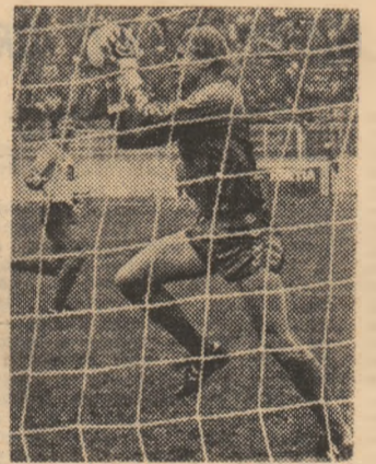
Portarul Schmeichel - una din piesele de rezistență ale noii campioane a Danemarcei

Desfășurat pe sistemul primăvară-toamnă, campionatul Danemarcei s-a încheiat la sfîrșitul