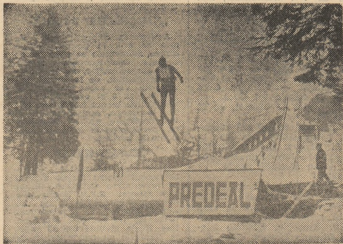
Saltul cu schiurile sau legea gravitației uitată pentru cîteva clipe...

— iată concluzia unei discuții despre săriturile cu schiurile