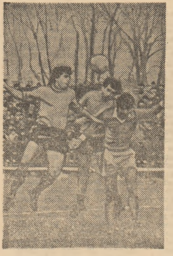
Spectaculoasă dispută pentru balon în jocul amical susținut miercuri de Otelul Galați (în echipament de culoare deschisă) la Slobozia cu echipa locală Unirea.

● GLORIA REȘIȚA - „POLI” TIMIȘOARA 0-0. (P. Fuchs - coresp.). ● MECON ORAȘ GH. GHEORGHIU-DEJ - GLORIA BUZAU 1-0 (1-0). Unicul gol a fost marcat de Arhire în min. 19. (GH. GRUNZU - coresp.). ● C.S.M. LUGOJ - „POLI” TIMIȘOARA 1-3 (0-2). Au înscris: Nemeș (min. 85 - din 11 m), respectiv Oloștean (num. 20), Trăistaru (min. 35) și Varga (min. 85 - din penalty). (C. OLARU - coresp.). ● AVINTUL REGHIN - O-LIMPIA SATU MARE 1-1 (1-1). Au marcat: Sălăjean (min. 14) respectiv Gerstenmeyer (min. 44). (I. ORMENIȘAN - coresp.). ● MUREȘUL DEVA - U.T.A. 0-2. (0-1). Au marcat: Mitu și Vancea. (I. JURCA - coresp.). ● DUMINICĂ 5 februarie, de la ora 11, frunțașă primei serie a Diviziei B, Petrolul Ploiești, va susține pe propriul stadion un atractiv joc amical cu Rapid București. ● CHIMIA RM. VILCEA - SPORTUL STUDENȚESC 2-0 (1-0). Au marcat: M. Nicolae (min. 9) și Lazăr (min. 77 - din penalty). (P. GEORNOIU - coresp.). ● UNIREA SLOBOZIA - O-TELUL GALAȚI 0-0. În cluda scorului alb, jocul a fost plăcut, cu faze spectaculoase. Echipa gălățeană a aliniat următorul „unsprezece”: Călușaru - Balcea, Anghelinel, Agiu, G. Popes-