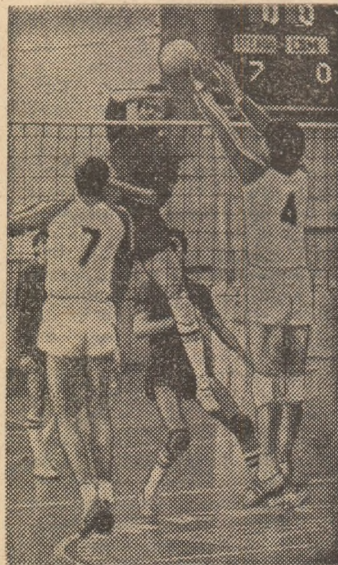
Șoica (Steaua) în dispută pe centrul fileului cu blocajul nesincronizat al sucevenilor

DACIA PITEȘTI — FARUL CONSTANȚA 3-0 (4, 3, 8). O întîlnire dominată clar de piteștence care au învins ușor. Au arbitrat: I. Armeanu și Gr. Nedelcu. (I. POPESCU, coresp.)