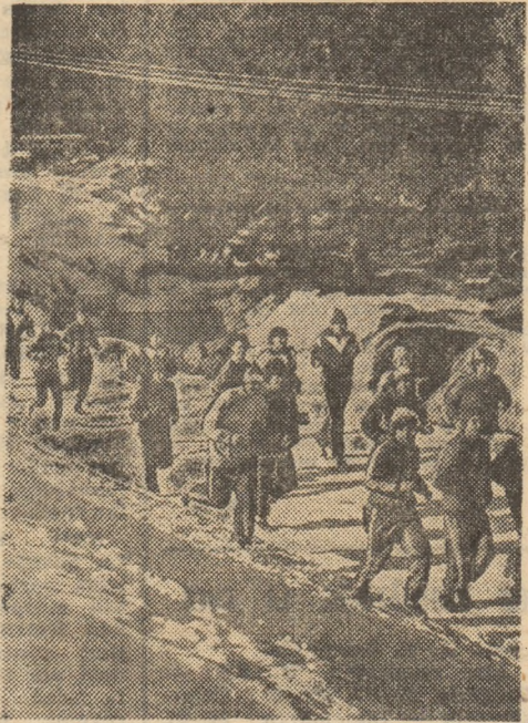
Prin pădurile din preajma Buștenilor, fotbalistii de la Rapid alegă, alegă...

prezenți și portarii de la tineret, Mincă (22) și Istode (19); Marinescu (29), Rada (29), Cirstea (24), Drăgan (25), Cristescu (21) — venit de la C.S.S. Timișoara), Musteștea (19) — din echipa de tineret, Estinca (23) — de la Steaua C.F.R. Cluj-Napoca), Bacoș (25) — fundași; Goanță (26), Drăghici (24), I. Lucian (22), Tismănar (25) — de la Minerul Moldova Nouă), Dragne (23) — de la Automati- ca Alexandria), Cristian (21) —