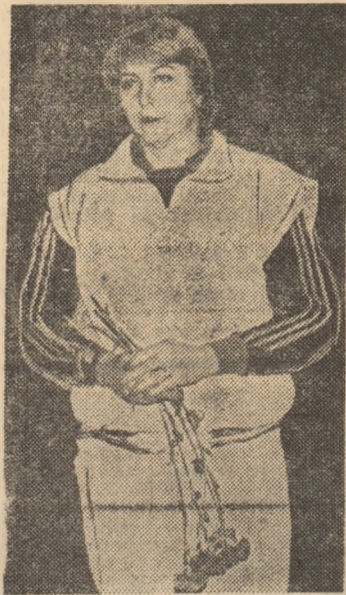
pierdut meciul? Sau că fără intervențiile dv. nu se cîștiga?

— Nu! N-aș mai fi fost o echipieră, ci o... vedetă, în sensul rîu al cuvîntului. Și mie vedetismul mi-a fost străin.