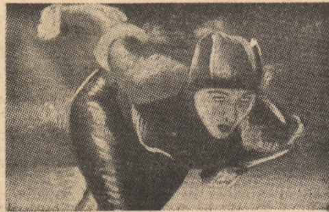
La C.M. de patinaj viteză, primele două clasate în proba feminină de poliațion, desfășurate la Lake Placid, au fost reprezentante ale R.D. Germane. Pe primul loc s-a clasat Constanze Moser (în imagine), urmată de Gunda Kleemann. Învingătoare, în vîrstă de 23 de ani, obține astfel cel mai mare succes al său, după ce se clasase tot în acest an, pe locul secund la Campionatele Europene.